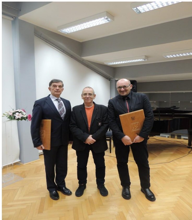
Ректор Универзитета са добитницима Светосавске награде, 27. јануар 2017. године

појединцу, за посебне или истраживачком тиму, за заједничке резултате, које су постигли у периоду од пет година које претходе години у којој се додељује награда.